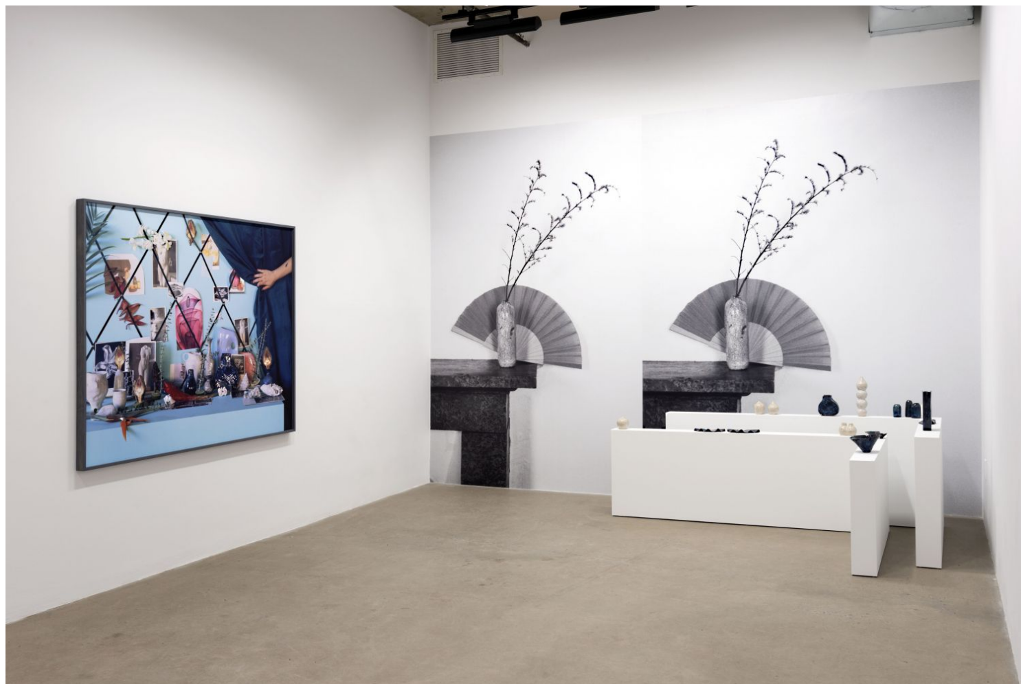
Vue de l'exposition «Pores», de Celia Perrin Sidarous

féminines étonnantes, et parfois sous l'emprise de stéréotypes, se faisant pieuse, jolie, ou s'adonnant à une danse débridée. Liées à une marchandisation culturelle, ces images dévoilent les lieux possibles de revendications croisant races, sexes et classes sociales.